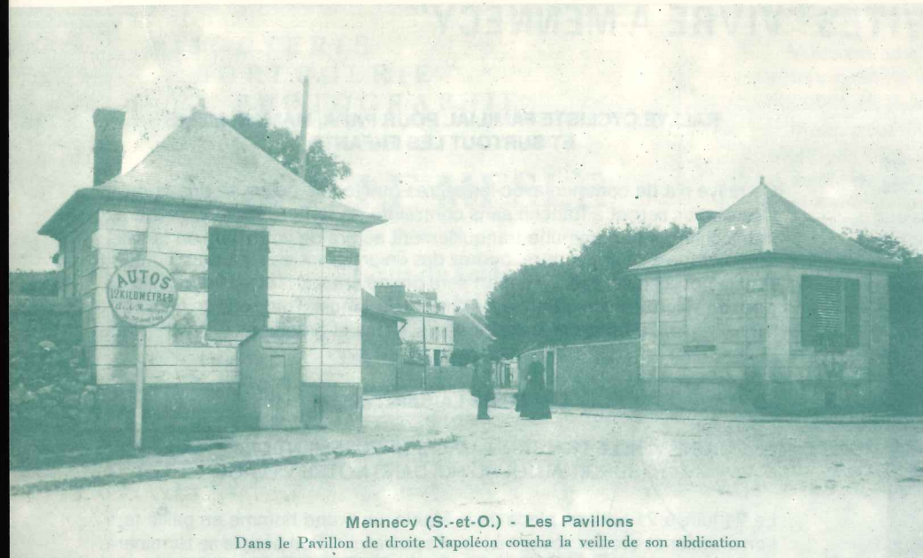
Mennecy (S.-et-O.) - Les Pavillons Dans le Pavillon de droite Napoléon coucha la veille de son abdication