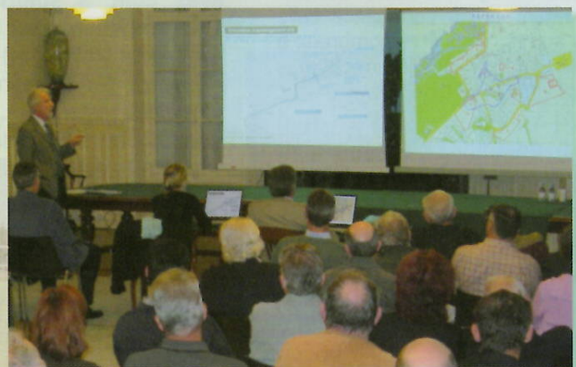
Présentation du PLU en séance publique le 4 octobre 2006

Une étude sur l'assainissement non collectif (SPANC) a été réalisée. Les avis de l'Etat, présentés par Monsieur le